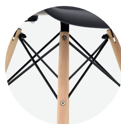
Estructura metálica negra