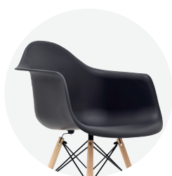
Asiento inyectado en polipropileno