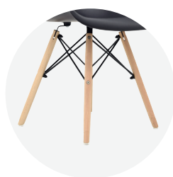
Patas en madera